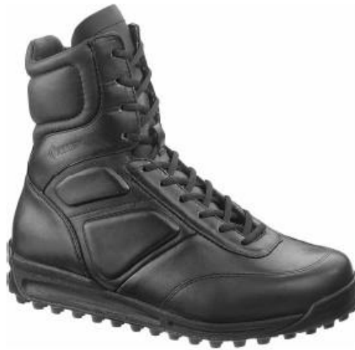
2245 / Spyder Falcon/ 8" All Leather Boot