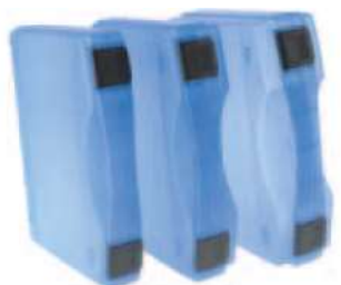
T 2003 S T 2003 M T 2003