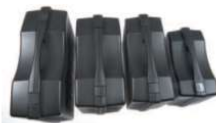
T 2055 B T 2037 BXL T 2037 B T 2026 B

De små TEKNO 2003 fås i tre forskellige tykkelser. Standardfarver: Sort, rød, blå, sølvgrå, gennemsigtig Låse: Sort, rød, blå. Indlæg produceres ud fra emnets vægt og funktion, så effekterne fastholdes og sikres.