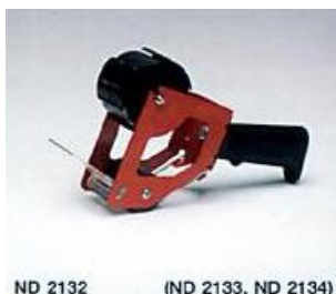
ND 2132 (ND 2133, ND 2134)