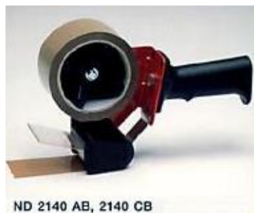
ND 2140 AB, 2140 CB