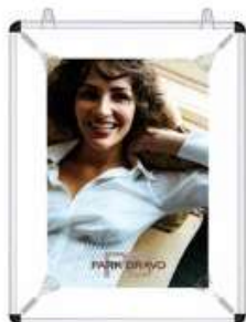
Poster strecher Model 249 Varianter 6