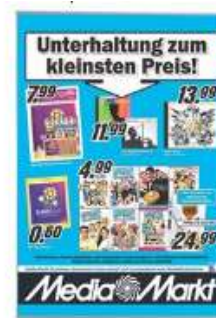
Plastic Window D-Pocket Model 1262 Varianter 5

- tilhørende aluminiumsprofiler er særdeles velegnet til montage i udstillinger, under overskabe, sammen med hyldebelysning og lignende. Med aluminiumsprofiler kan der bruges en IP20 LED-strip, og med særskilte akrylfronter kan der skabes unikke produkter, der særegent kan produceres i flere farver og med de særpræg De må ønske det.