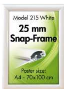
Alu Snap-Frame væg 25 mm hvid Model 215 Varianter 6