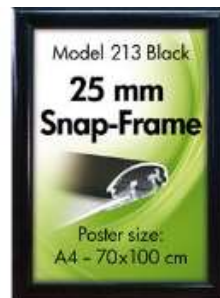
Alu Snap-Frame væg 25 mm sort Model 213 Varianter 6