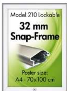
Lockable Snap-Frame, væg, 32 mm Model 210 Varianter 6