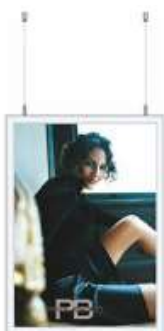
Double Sided Snap-Frame Model 247 Varianter 6

SE-nr. 36 70 29 66 Bank 6850 0001012998 - EMGJ Holding Aps.