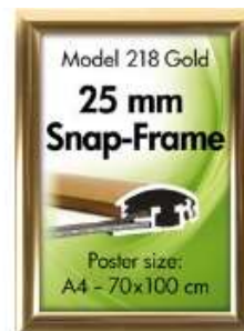
Alu Snap-Frame væg 25 mm guldeloxeret blank Model 218 Varianter 6