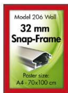
Alu Snap-Frame, væg, 32 mm - rød Model 206 Varianter 6