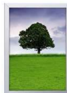
Dobbeltsidet vinduesramme 32 mm Model 242 Varianter 4

Akustikplader med print fungerer som lydæmpende billeder, og kan tilføres efter deres krav.