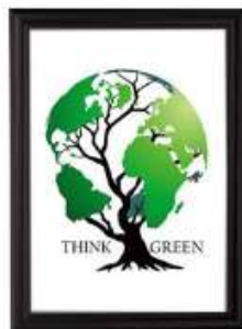
Antique Snap-Frame black væg 40 mm Model 224 Varianter 8