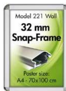
Alu Snap-Frame rondo væg 32 mm sølveloxeret Model 221 Varianter 7