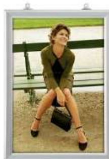
Slide-In Frame 25 mm vertikal Model 245 Varianter 5