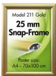
Alu Snap-Frame væg 25 mm guldeloxeret - mat Model 211 Varianter 6