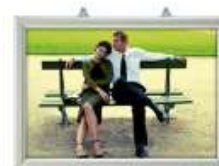
Slide-In Frame 25 mm, horisontal Model 246 Varianter 5