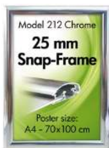
Alu Snap-Frame væg 25 mm chrome Model 212 Varianter 6