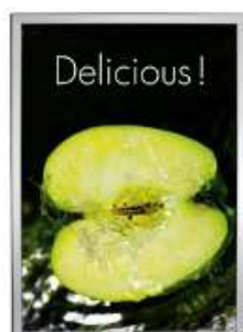
Opti Snap-Frame 32 mm Model 234 Varianter 2