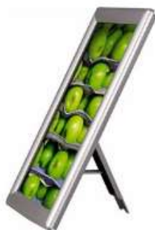
Photo Snap-frame, 25 mm med bagstøtte Model 238