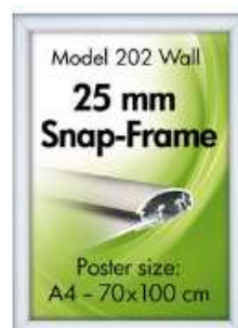
Alu Snap-Frame, Væg, 25 mm, sølvlokeret Model 202 Varianter 8