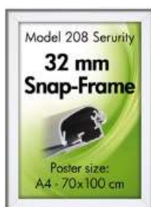
Security FrameVæg, 32 mm Model 208 Varianter 6