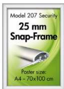
Security Frame, væg, 25 mm Model 207 Varianter 6