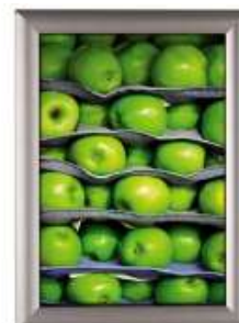
Opti Snap-frame 25 mm Model 232 Varianter 5