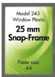
Window plastramme Model 243 Varianter 2