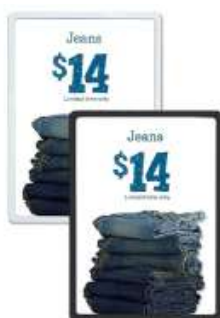
Flex plastprisramme Model 244 Varianter 6