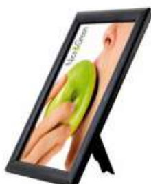
Photo Snap-Frame 25 mm med bagstøtte sort Model 239