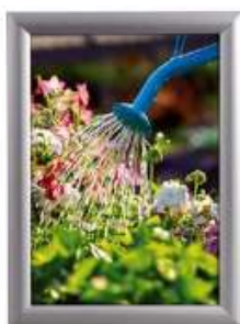
Alu Snap-Frame Watersafe væg 25 mm sølv Model 226 Varianter 3

SE-nr. 36 70 29 66 Bank 6850 0001012998 - EMGJ Holding Aps.