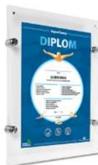
Acrylic Wall Frame Model 1264 Varianter 4