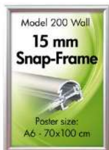
Alu Snap-Frame, væg, 15 mm Model 200 Varianter 8

Plakatrammer, vægrammer og snaprammer kan leveres direkte fra lager i utallige variationer, i den højeste kvalitet, og med garanti. Rammerne produceres på verdens førende fabrikker inden for feltet.