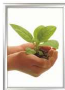
Dobbeltsidet vinduesramme 25 mm Model 241 Varianter 2