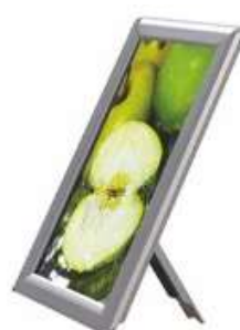
Photo Snap-Frame 14 mm med bagstøtte Model 236 Varianter 3