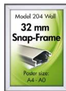
Alu Snap-Frame, væg, 32 mm Model 204 Varianter 7