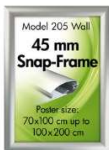
Alu Snap-Frame, væg, 45 mm Model 205 Varianter 5

SE-nr. 36 70 29 66 Bank 6850 0001012998 - EMGJ Holding Aps.