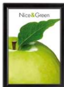
Opti Snap-Frame 14 mm sort Model 231 Varianter 3