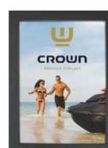
Crown Snap Frame 33 mm Model 222 Varianter 9