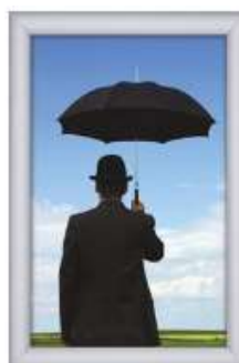
Alu Snap-Frame Watersafe væg 35 mm sølv Model 228 Varianter 4