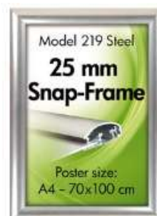
Alu Snap-Frame væg 25 mm stainless steel look Model 219 Varianter 6