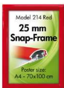
Alu Snap-Frame væg 25 mm rød Model 214 Varianter 6