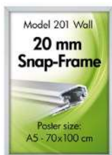
Alu Snap-Frame, væg, 20 mm Model 201 Varianter 7