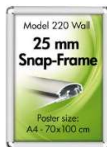
Alu Snap-Frame rondo væg 25 mm sølvlokeret Model 220 Varianter 7

Se mere om mulighederne på vor hjemmeside: www.5610.eu > www.danskskiltereklame.dk > http://www.danskerhvervsbeklaedning.dk/bearbejdning/skiltning/228/sider/228.htm