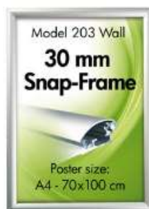
Alu Snap-Frame, væg, 30 mm Model 203 Varianter 6