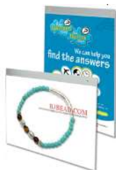
Acrylic Hanging Sign Model 1245 Varianter 6