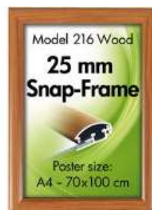
Alu Snap-Frame væg 25 mm trælook Model 216 Varianter 6