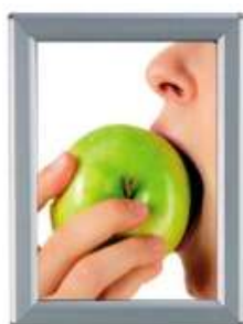
Opti Snap-Frame 14 mm Model 230 Varianter 3