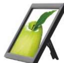
Photo Snap-Frame 14 mm med bagstøtte sort Model 237 Varianter 3