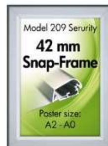
Security frame, væg, 42 mm Model 209 Varianter 5

- tilhørende plakater og andet bogtryk kan naturligvis medleveres, i små eller større kvanta.