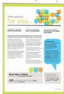
Plastic Window U-Pocket Model 1260 Varianter 3