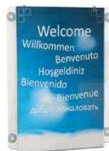
Window Frame med sugeskop. Akryl Model 1265 Varianter 3